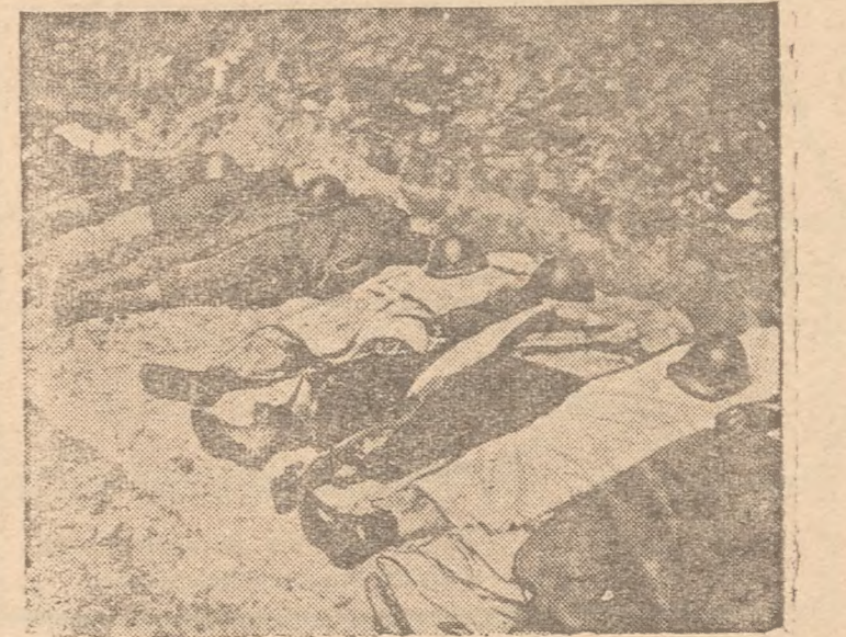
Zij gingen als vrijwilligers, en vielen.